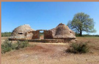
Super Cayrou refuge artistique Gréalou (46) © Encore heureux architectes