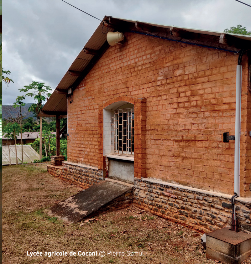
Lycée agricole de Coconi

ARCHITECTURE FRUGALE EN OUTRE-MER LIVRE par l'association Frugalité heureuse et créative