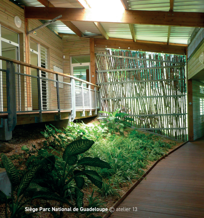
Siège Parc National de Guadeloupe